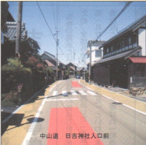
中山道 日吉神社入口前