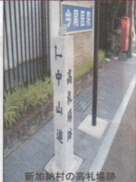
新加納村の高札場跡

定 何事によらず宜しからざる事に大勢申合せ候を徒党と唱え徒党して強いて願ひ事企てるを強訴といひ、或は申合せ居町居村を立退き候を逃散と申す堅く御法度たり 若右類の儀之あらば早々其筋の役所へ申出べし御褒美下さるべく事