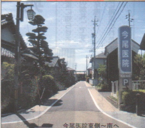
今尾医院東側～南へ