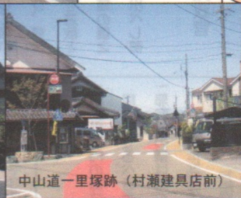
中山道一里塚跡（村瀬建具店前）