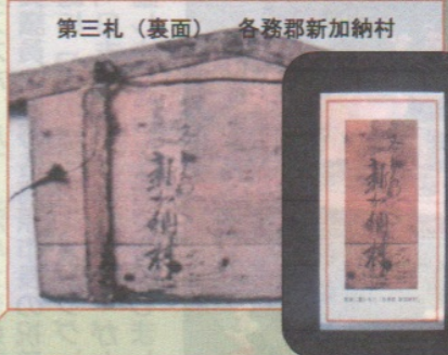
第三札(裏面) 各務郡新加納村

今回、岐南町の協力により各務原市へ里帰りし、保存活用できる事になりました。(各務原市歴史民俗資料館) 裏面には「各務郡新加納村」の墨書があり、中山道新加納の高札場に掲示されたことが分かります。