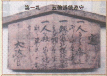
第一札 五倫道德遵守

慶応四年(明治元年)1868年3月、中山道新加納村の高札場に掲げられた五枚の内四枚が残っていました。今、輪沼宿町屋館で特別公開中です。