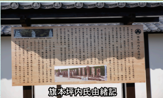
旗本坪内氏由緒記