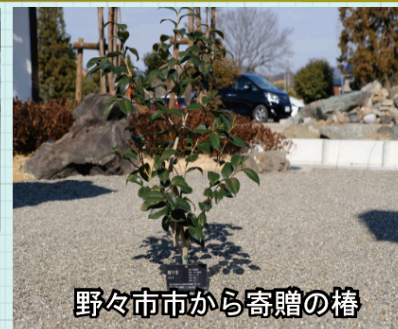
野々市市から寄贈の榎

坪内氏ゆかりの地、富樫郷石川県野々市市から寄贈の榎の木です。野々市榎として全国的に有名です。